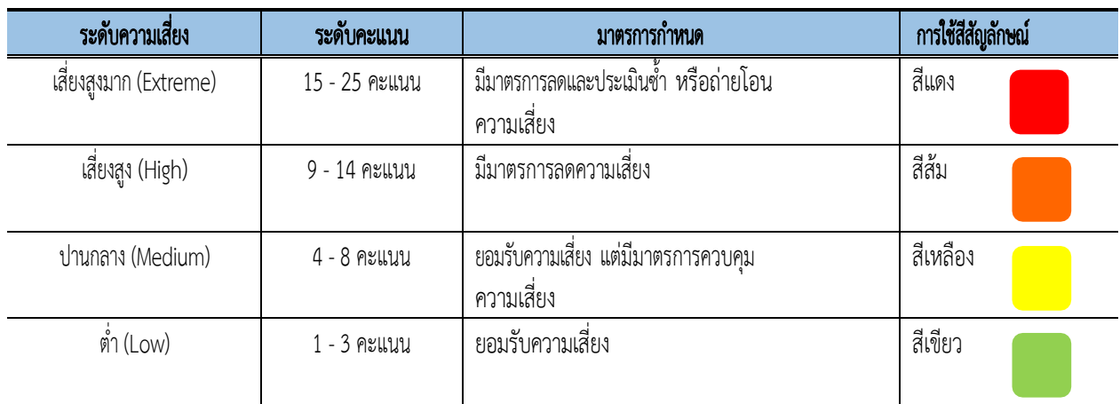
ตารางระดับของความเสี่ยง (Degree of Risk)

ซึ่งจัดแบ่งเป็น 4 ระดับสามารถแสดงเป็น Risk Profile แบ่งพื้นที่เป็น 4 ส่วน (4 Quadrant) ใช้เกณฑ์ในการจัดแบ่ง ดังนี้